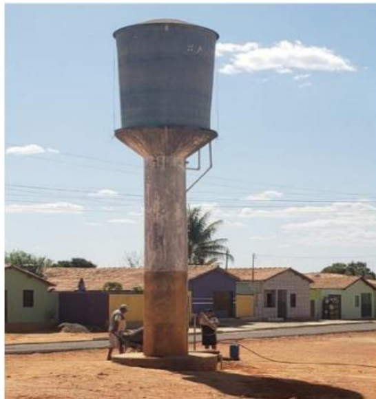
Figura 1 - População de Jacaré coletando água (2022)

A implementação das cisternas de 16 mil litros na comunidade do Jacaré representa uma inflexão relevante nas condições de acesso à água para consumo humano, sobretudo quando comparada às formas anteriores de abastecimento. Antes da presença dessas tecnologias, o acesso à água era marcado por forte instabilidade, dependência de fontes externas e elevado dispêndio de tempo e esforço físico, especialmente por parte das mulheres e crianças, historicamente responsáveis pelo manejo doméstico da água, como representado na Figura 1.