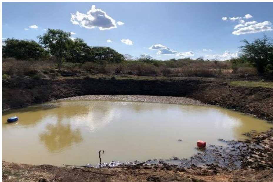
Figura 2 - Lagoa do Jacaré